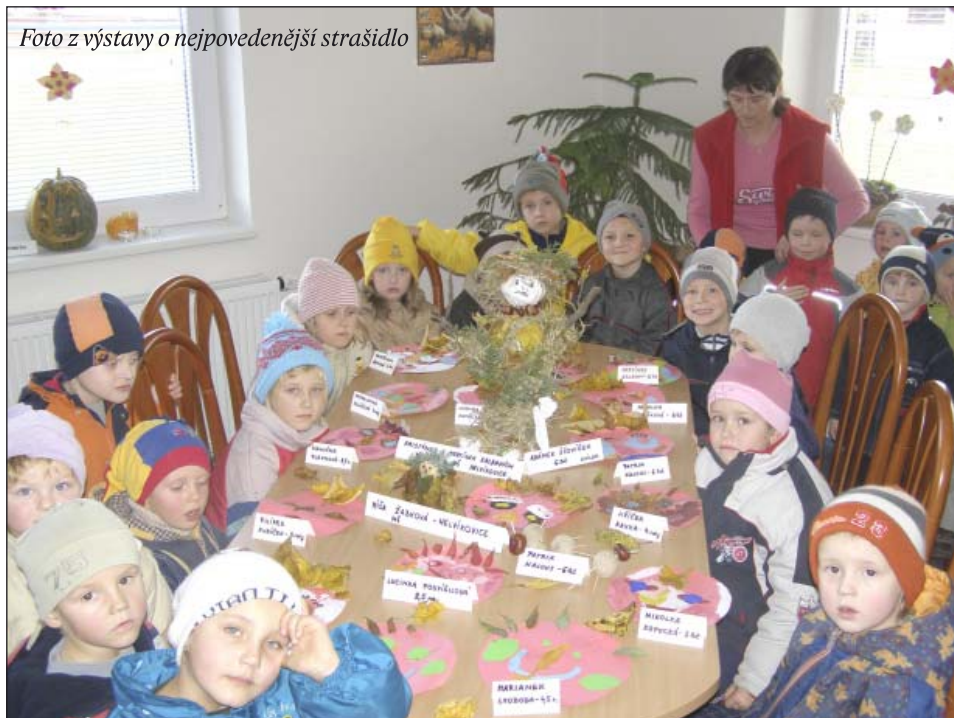
Foto z výstavy o nejpovedenější strašidlo

Obec Helvíkovice srdečně zve všechny občany na tradiční