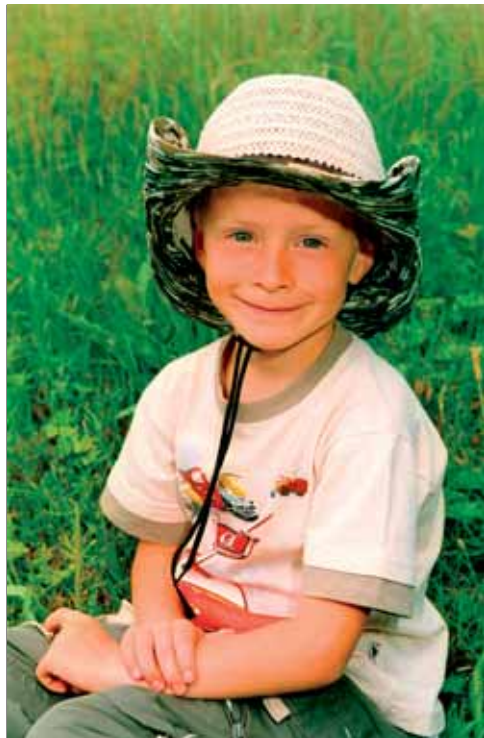
Šťastné a spokojené dítě v MŠ

velmi milá atmosféra. Dětem se ve škole moc líbilo.