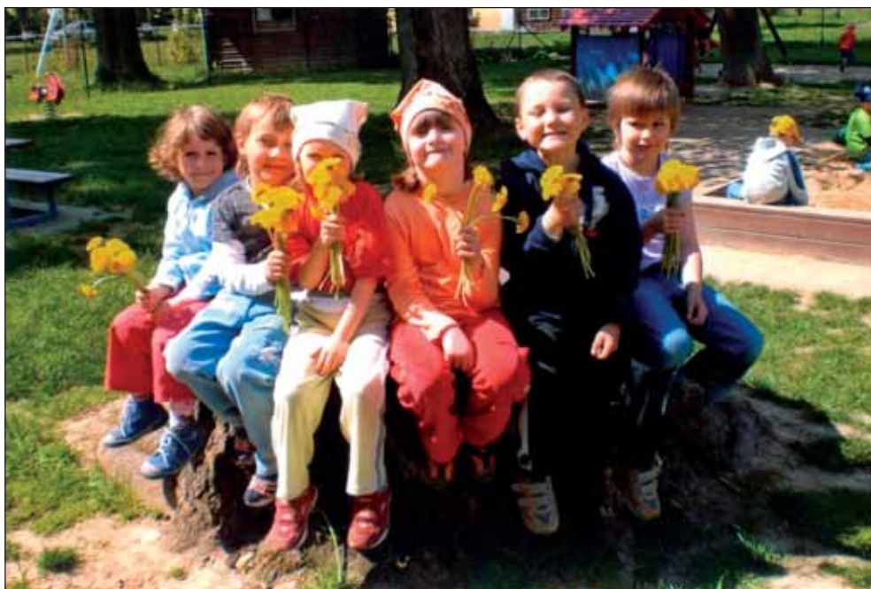
Děti z MŠ