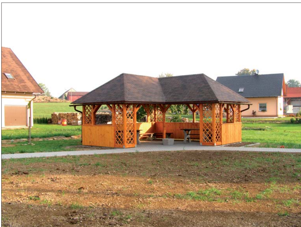
Nový altán před OÚ