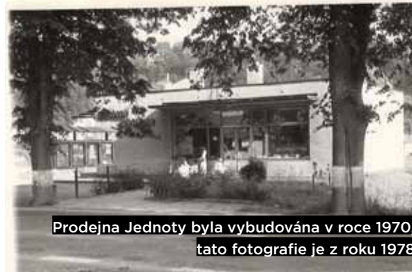
Prodejna Jednoty byla vybudována v roce 1970, tato fotografie je z roku 1978