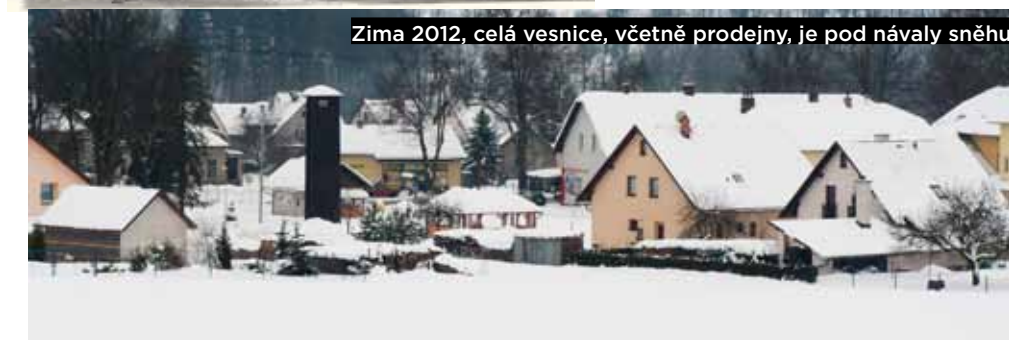
Zima 2012, celá vesnice, včetně prodejny, je pod návaly sněhu