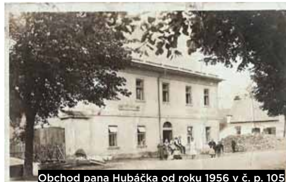
Obchod pana Hubáčka od roku 1956 v č. p. 105