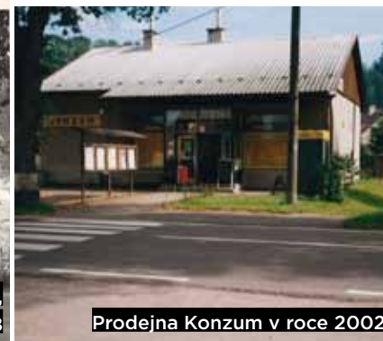
Prodejna Konzum v roce 2002