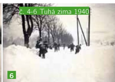
č. 4-6 Tuhá zima 1940