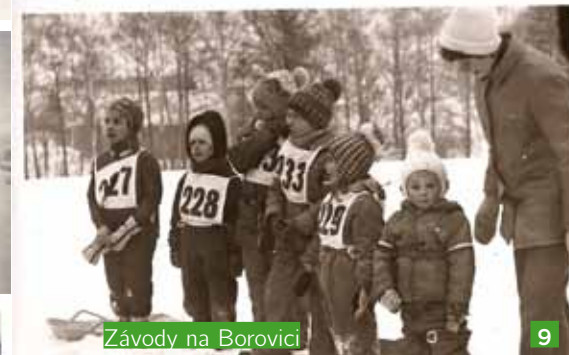
Závody na Borovici