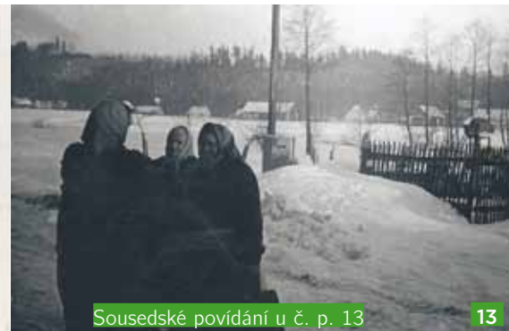
Sousedské povídání u č. p. 13