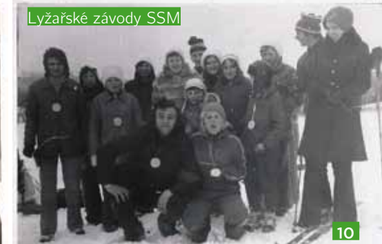
Lyžařské závody SSM