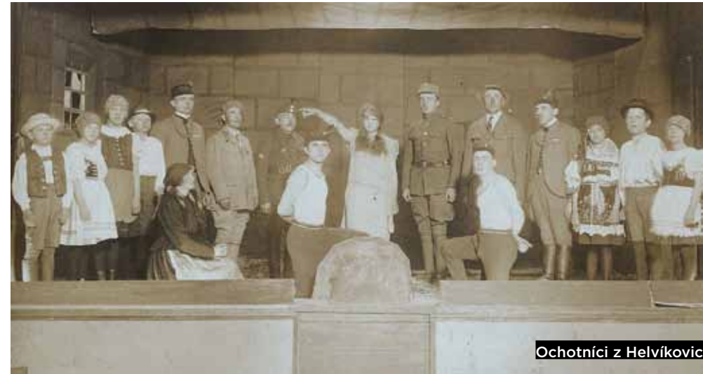
Ochotníci z Helvíkovic