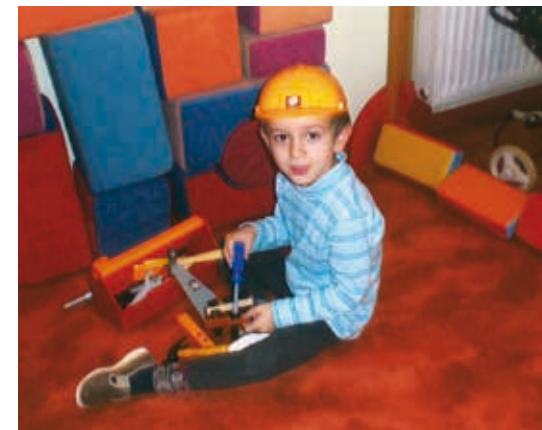
Připravila Anna Janebová

Naše mateřská škola je otevřená rodičům, je místem, kde jsou rodiče vítáni a kam mohou bez obav vstupovat a hovořit o všem, co je při výchově tíží nebo naopak těší.