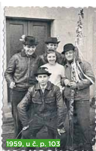
1959, u č. p. 103