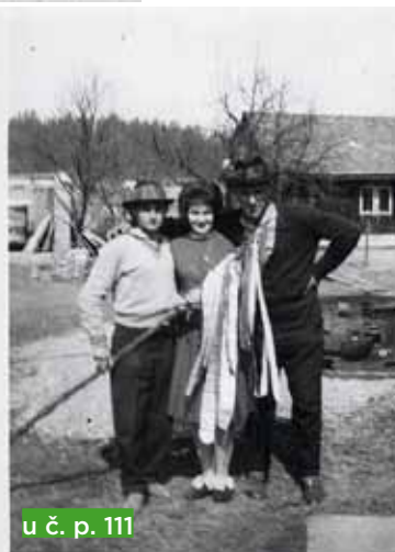
u č. p. 111