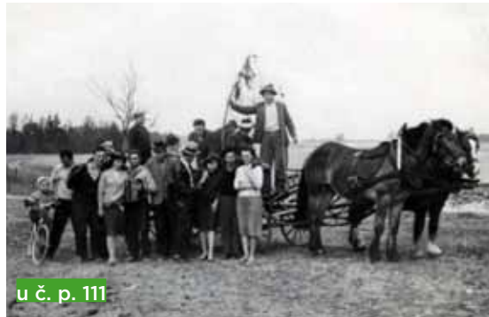
u č. p. 111