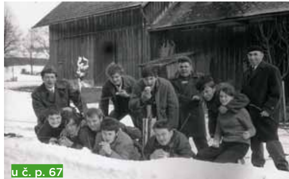
u č. p. 67