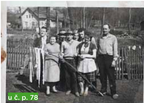
u č. p. 78