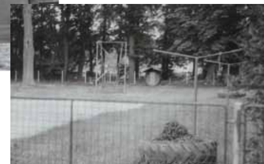
Mateřská školka a dětské hřiště, 1978