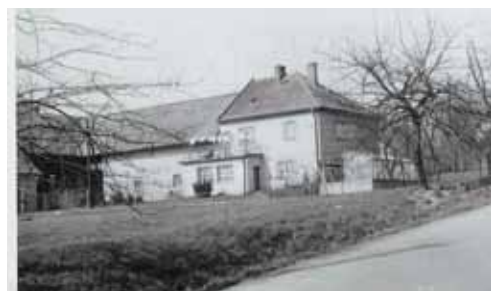
Dům č.p. 115 rodiny Michaličkových - 1948 vlevo a 1978 vpravo