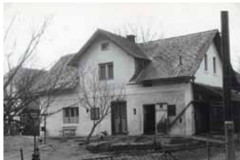
Dům č.p. 43 rodiny Durčánkových, Nunvářových - 1948 vlevo a 1978 vpravo