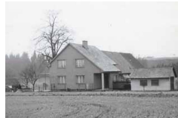
Dům č.p. 109 rodiny Koukolových, Vostřelových - 1948 vlevo a 1978 vpravo