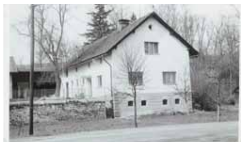
Dům č.p. 12 rodiny Houdkových - 1948 vlevo a 1978 vpravo