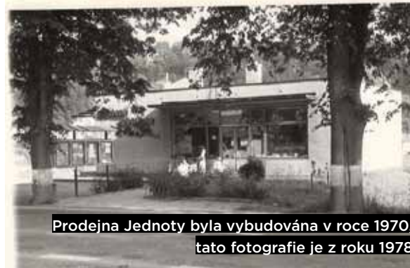
Prodejna Jednoty byla vybudována v roce 1970, tato fotografie je z roku 1978