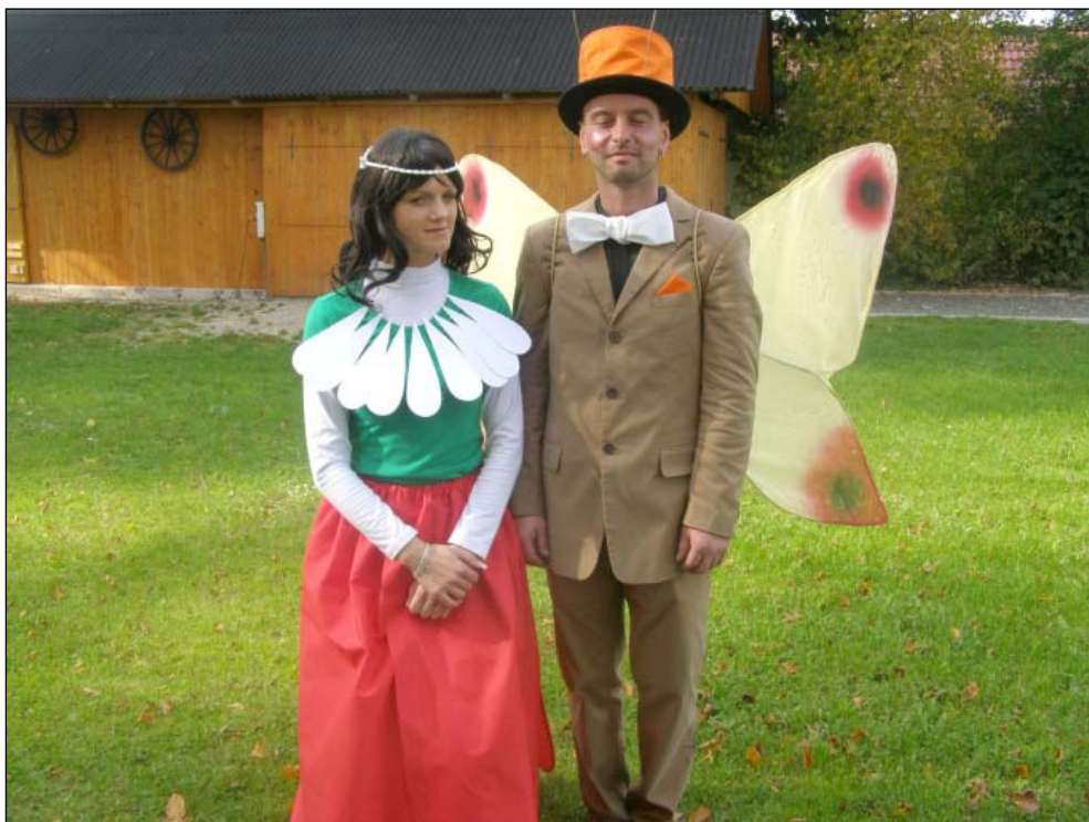
Broučkáda v Helvíkovicích