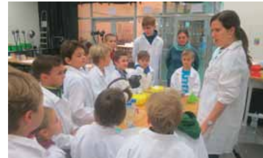
Pilotáž - Noc vědců v podání DDM Kamarád Česká Třebová

Veškeré informace najdete na www.maporlicko.cz . Zde je k dispozici i KVARTETO ze školního prostředí, které jsme zpracovali a které si můžete zdarma stáhnout a zahrát.