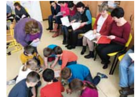
Ukázková hodina na téma Spolupráce učitele a asistenta pedagoga