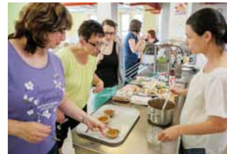
Praktický seminář na téma Luštěniny