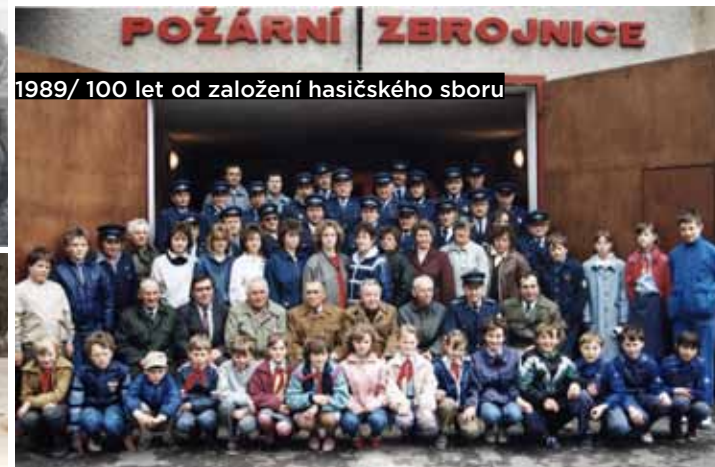
1989/ 100 let od založení hasičského sboru