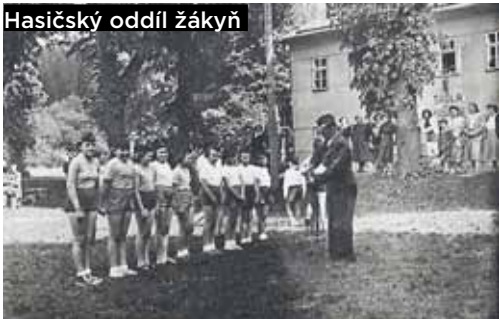
Hasičský oddíl zákyň