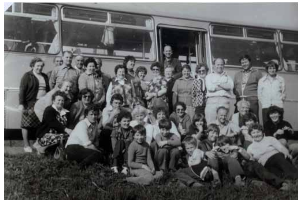
Zájezd pro děti a dospělé do Beskyd