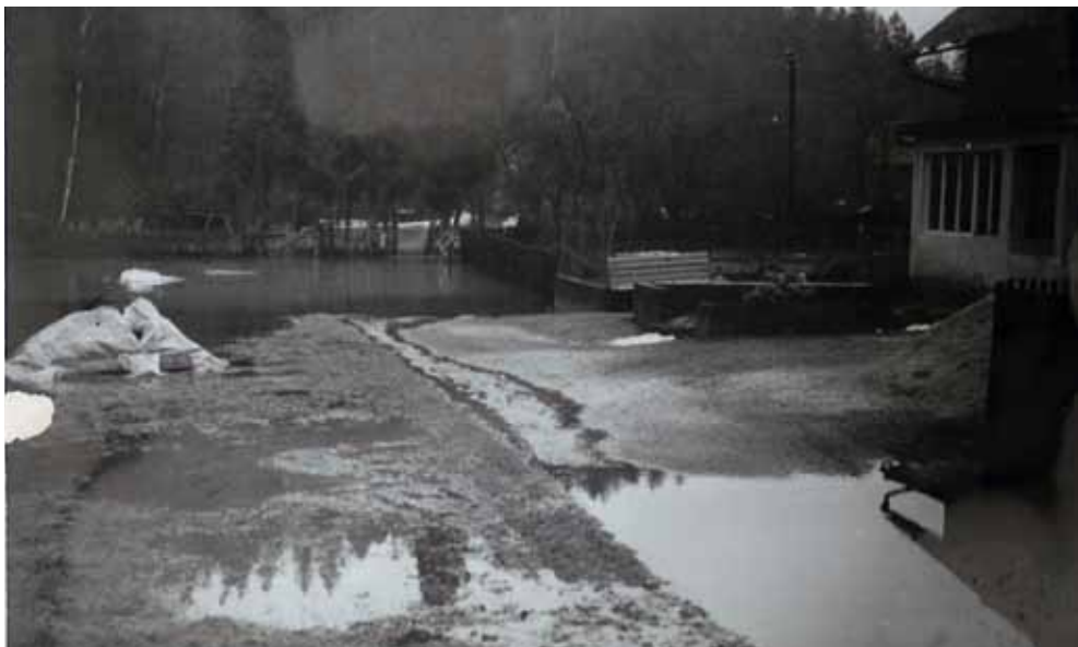
Zaplavená cesta před Blažkovými č. p. 36 při jarním rozvodnění Divoké Orlice