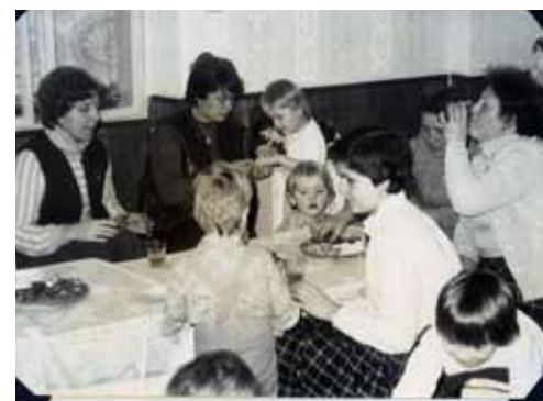
Maminky při besídce v družném hovoru