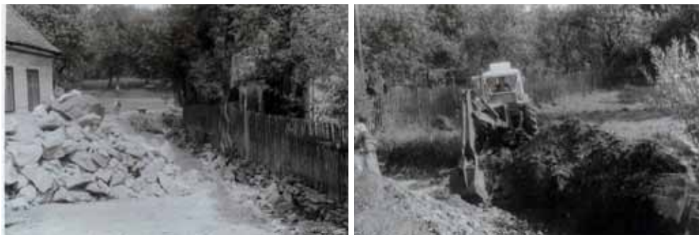
Regulace Kamenského potoka v úseku od č. p. 60 po č. p. 57