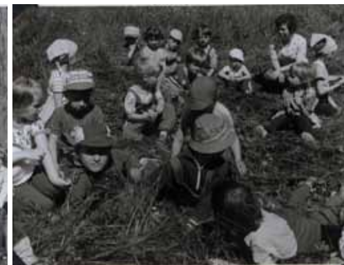
Děti z MŠ na výletě v dolích