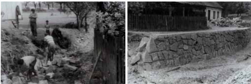
Regulace po dokončení prací