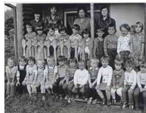
Děti z MŠ společně se zaměstnanci před chatkou na zahradě