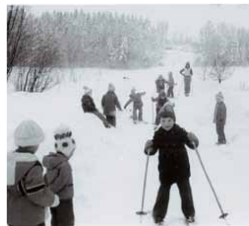
Zimní radovánky dětí z MŠ v opravdové zimě