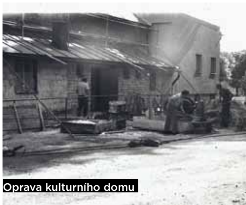
Oprava kulturního domu