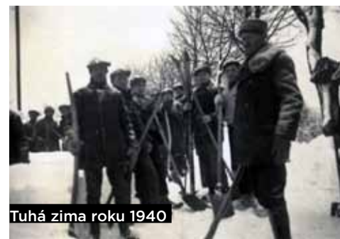
Tuhá zima roku 1940