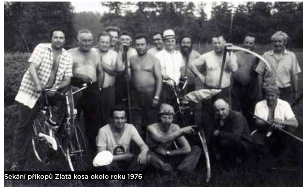
Sekání příkopů Zlatá kosa okolo roku 1976