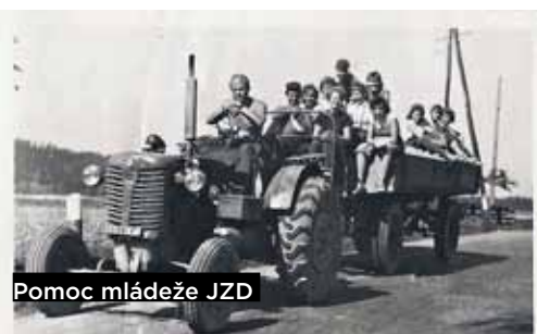
Pomoc mládeže JZD