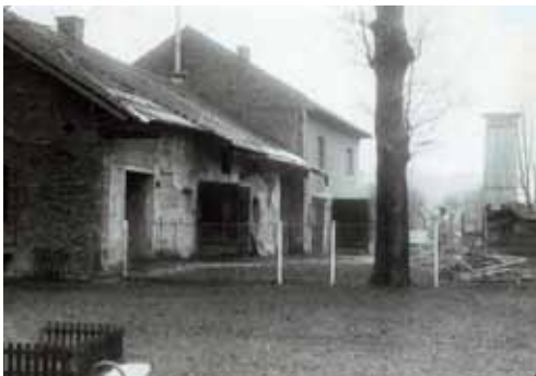
Staré skladiště a garáže - práce při bourání