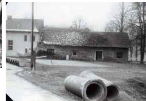
Staré skladiště a garáže - těsně před zbouráním