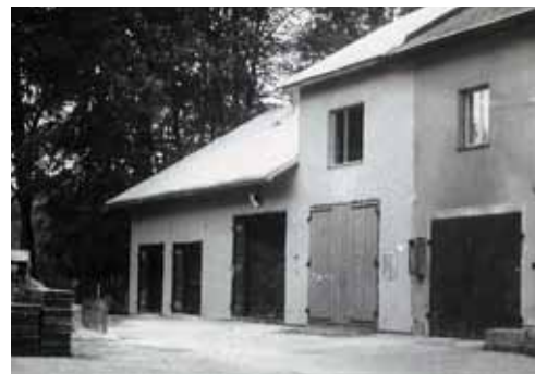
Rozšíření a rekonstrukce garáží - přístavba k budově občanského výboru. Pohled zepředu - vlevo vrata ke garáži myslivců, sklad topiva pro kulturní dům, garáže požárníků. Nahoře - klubovna požárníků