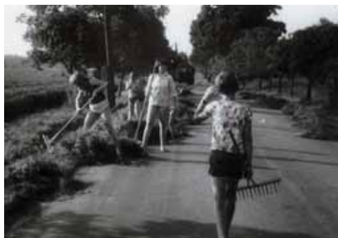
Mladí požárníci při sklizni příkopů