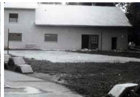
Pohled zezadu - dokončené