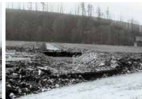
Regulace Kamenského potoka a odlehčovací kanál do Divoké Orlice