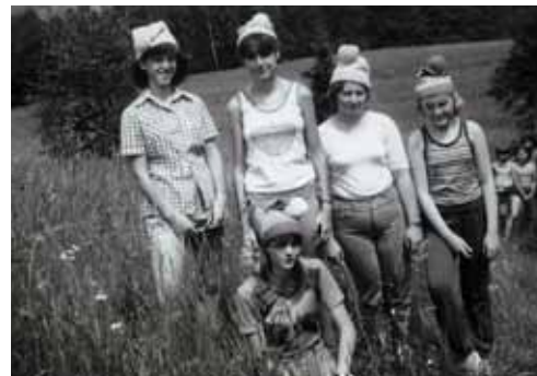
Dětský den - procházka pohádkovým lesem, studentky jako trpaslíci.