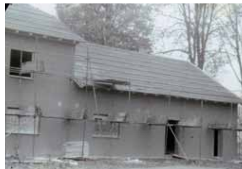
Pohled zezadu, sklad obč. výboru, vzadu klubovna Sokola - nedokončené