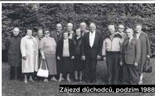
Zájezd důchodců, podzim 1988