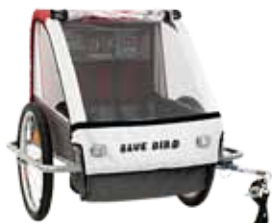
Point Helmig Blue Bird

Špatné hodnocení obsahu nežádoucích látek nemusí nutně znamenat, že by daný vozík představoval pro dítě bezprostřední zdravotní riziko. Ovšem i tak jsou nežádoucí látky důvodem, proč dTest všechny hříšníky nechal propadnout. „Lze namítnout, že jde o příliš přísný krok – děti přece obvykle vozíky neolizují. Jenže podle nás je jakýkoliv obsah potenciálně nebo prokazatelně