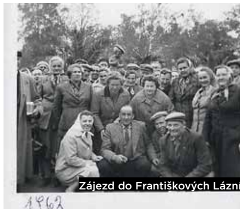
Zájezd do Františkových Lázní