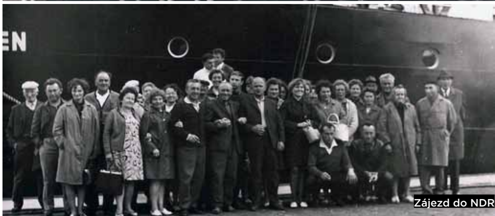
Zájezd do NDR