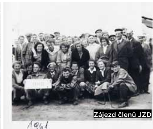
Zájezd členů JZD