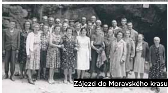
Zájezd do Moravského krasu