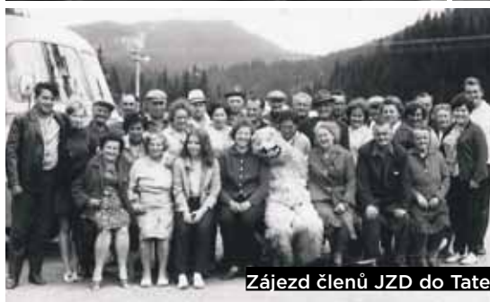
Zájezd členů JZD do Tater