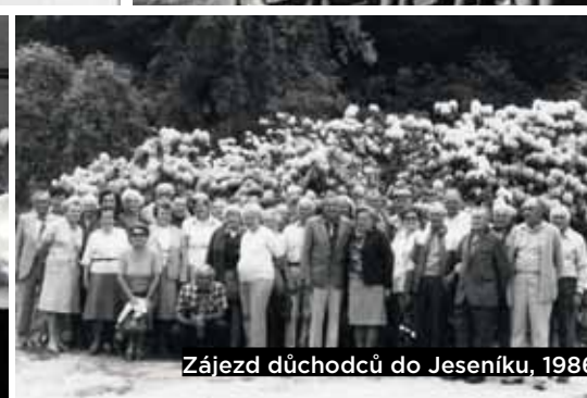
Zájezd důchodců do Jeseníku, 1986