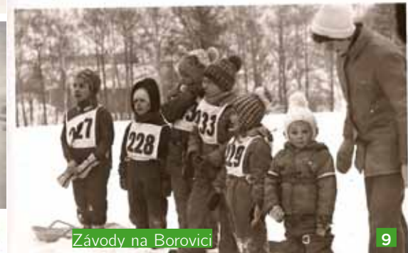
Závody na Borovici