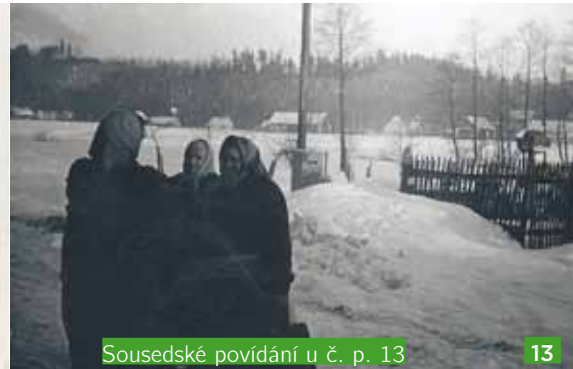
Sousedské povídání u č. p. 13