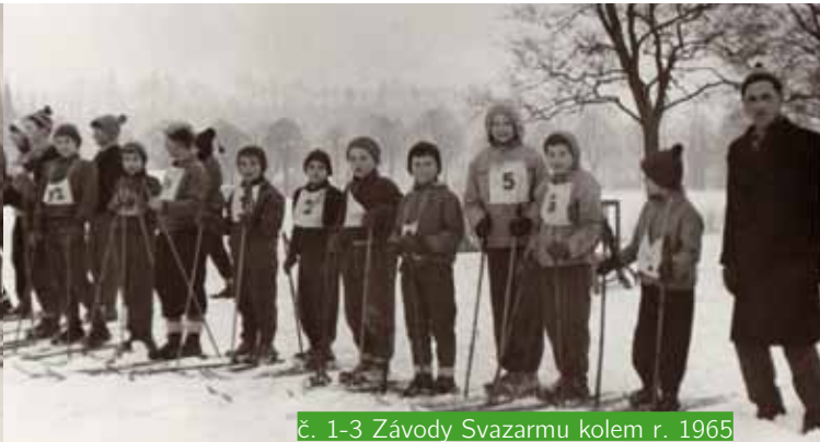
č. 1-3 Závody Svazarmu kolem r. 1965