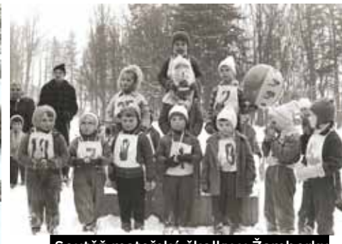
Soutěž mateřské školky v Žamberku