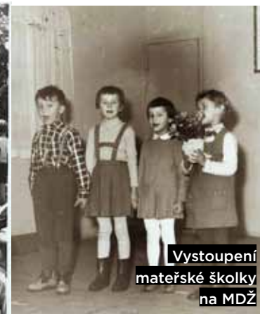
Vystoupení mateřské školky na MDŽ