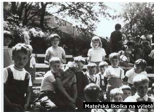
Mateřská školka na výletě